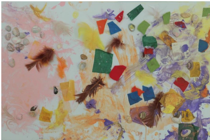
Zeit in der Krippe für Kreativität, Materialerfahrung, Wahrnehmung und eigene Bedürfnisse aus der Krippe Münnichstr.

Eine Ausbildung in Krippengruppen für Kinder im Alter von 0 bis 3 Jahren kann auch in Kombi-Kitas erfolgen, in denen sich die Krippen- und Kindergartengruppen unter einem Dach befinden. Diese Gruppen beschreiben wir im Abschnitt „Kitas mit Krippen- und Kindergartengruppen unter einem Dach“.