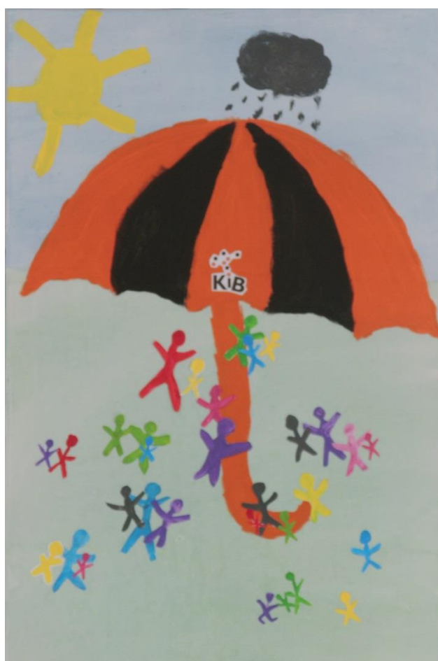
„Verlässlichkeit ist, wenn es für alle einen großen Schirm gibt, unter dem alle Schutz finden“ aus der Ganztags-Grundschule Heiligengeisttor